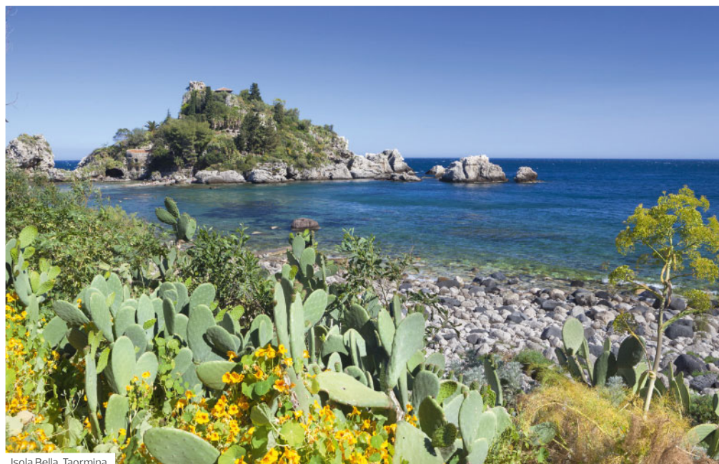
Isola Bella, Taormina