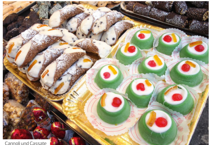
Cannoli und Cassate